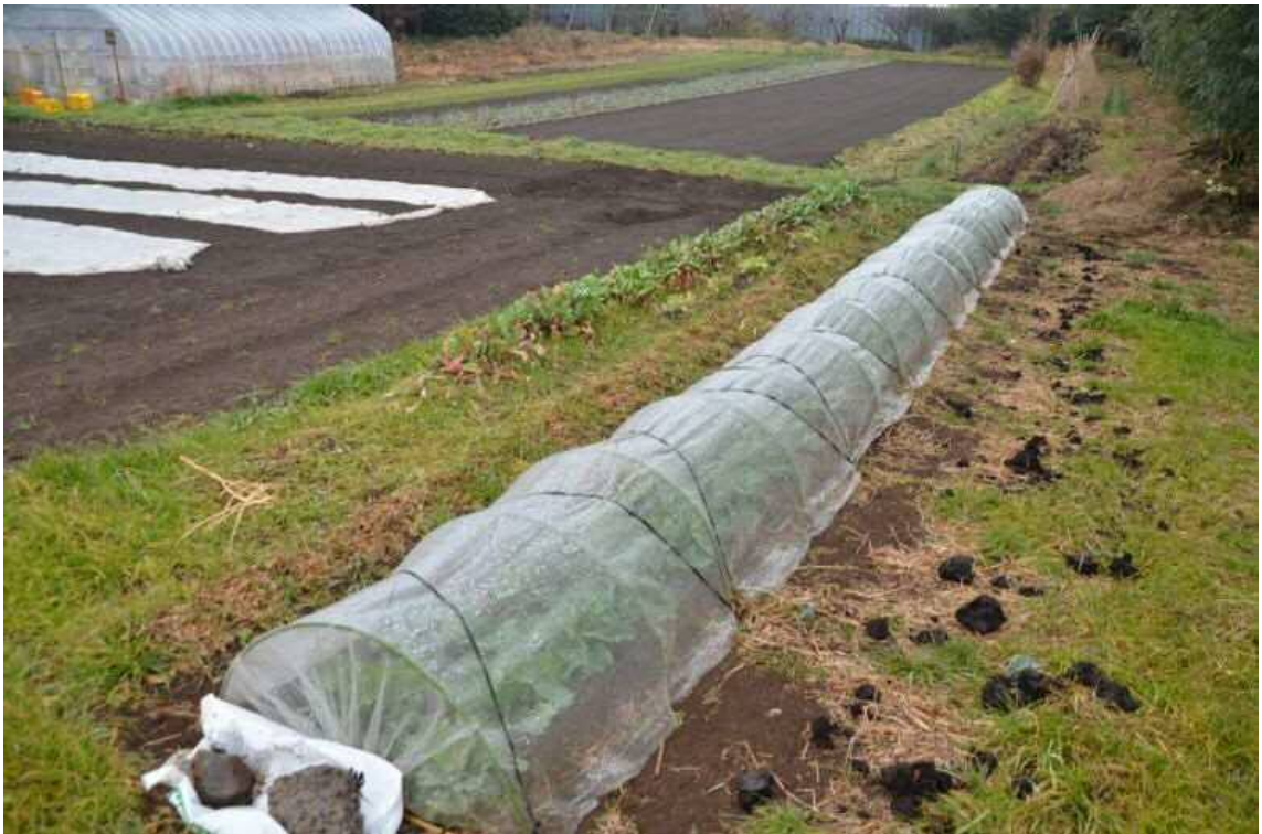
2017年2月9日、天神峰農地。東南側からキャベツ、春菊畑を撮影した。