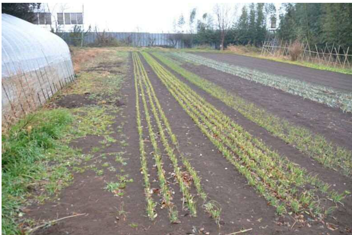
2017年2月9日、天神峰農地。ハウス東側のネギ苗を撮影した。