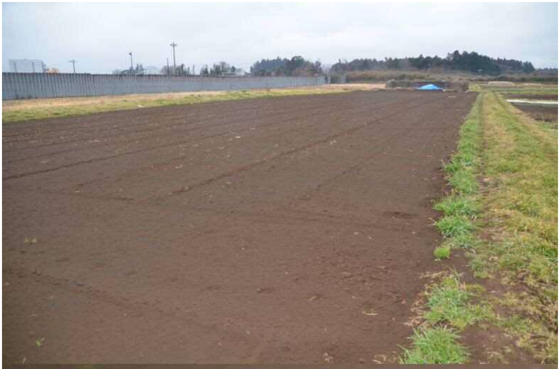
2017年2月9日、南台農地。農道東端から南西側の里芋収穫、堆肥を入れた畑を撮影した。