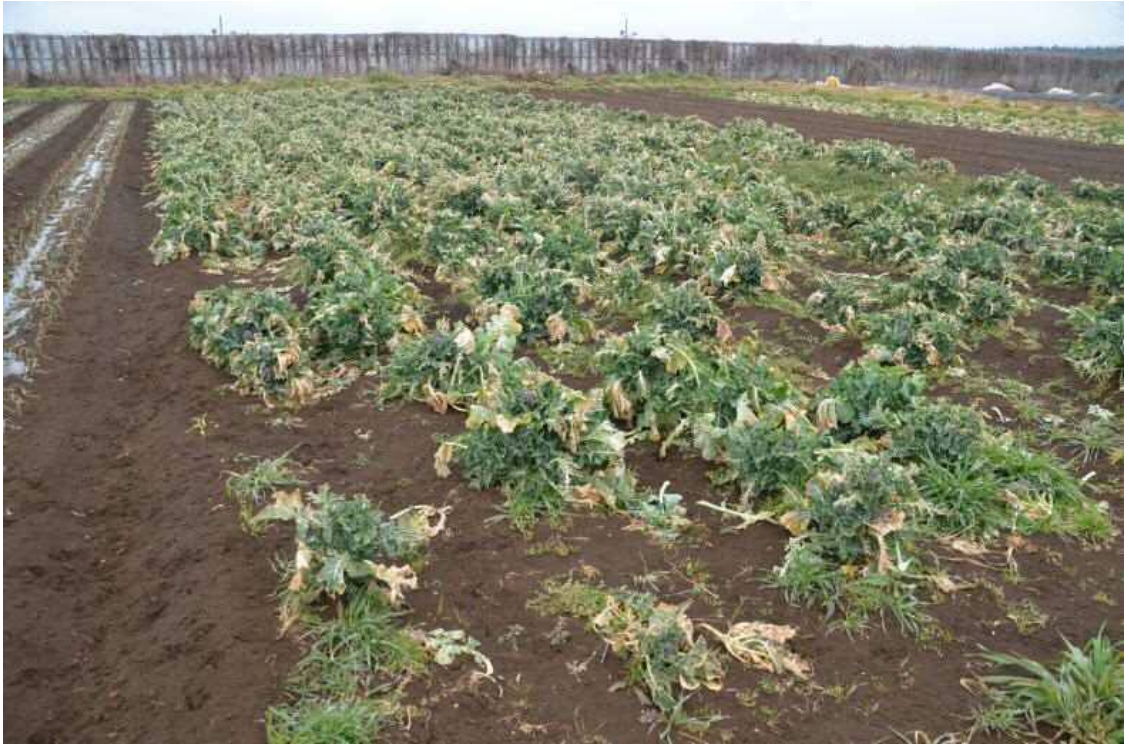
2017年2月9日、南台農地。農道から北側の収穫済みのブロッコリー畑を撮影した。