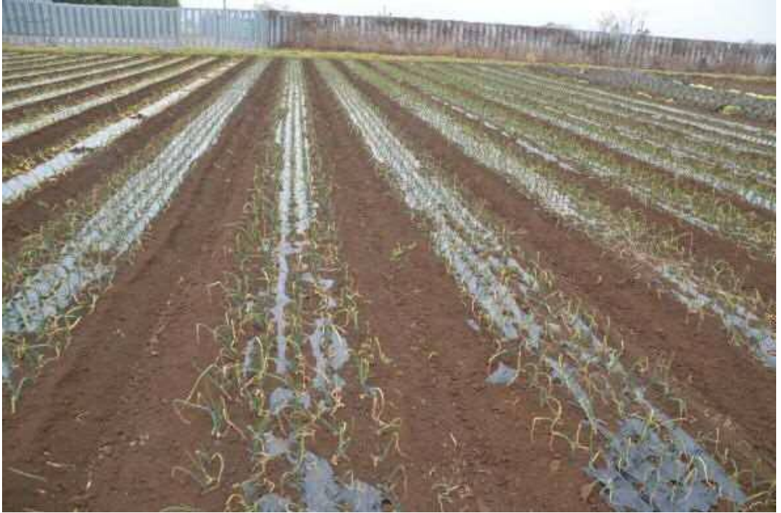
2017年2月9日、南台農地。農道から北側の玉ネギ畑を撮影した。