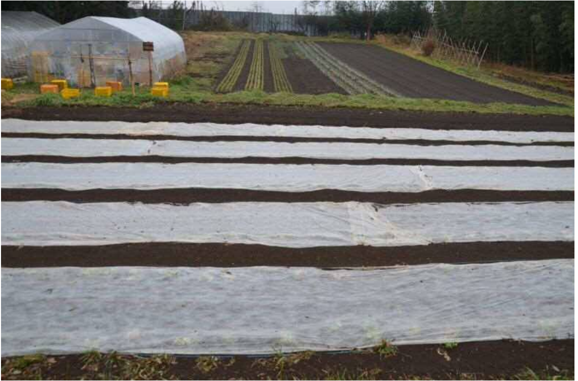
2017年2月9日、天神峰農地。旧県道から北側のスナックエンドウ、長ネギ畑を撮影した。