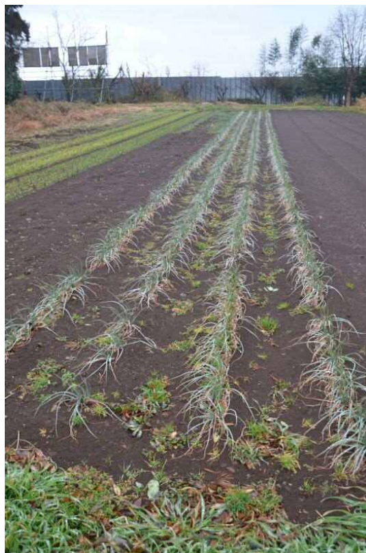
2017年2月9日、天神峰農地。ビニールハウス東側のらっきょう畑。