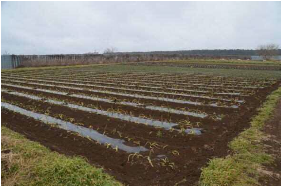
2017年2月9日、南台農地。農道の西端から北東側を撮影した。手前はニンニク畑