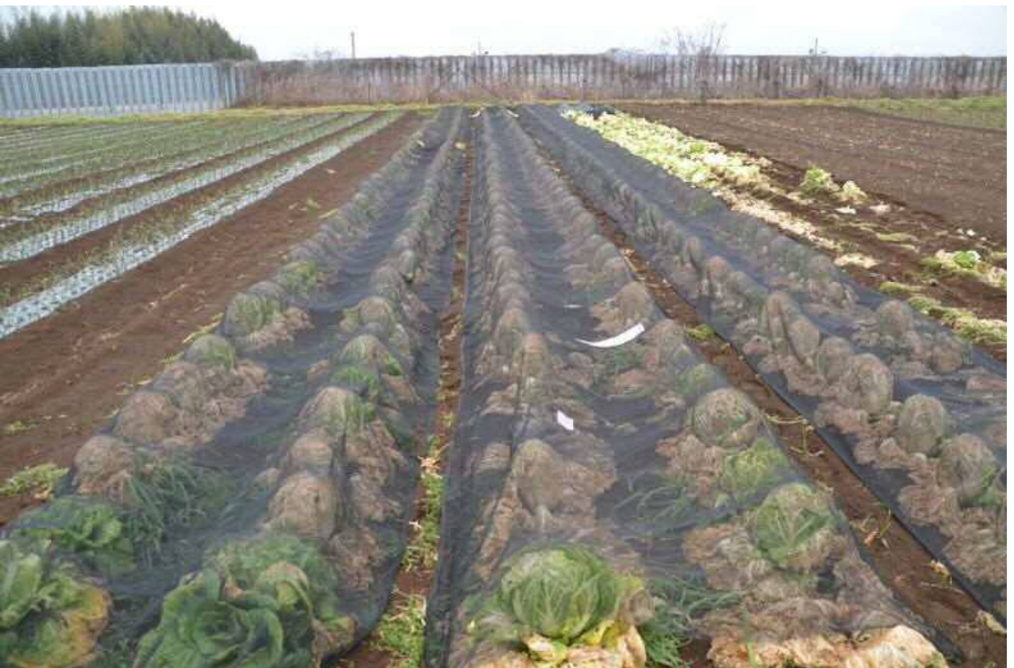
2017年2月9日、南台農地。農道から北側の白菜畑を撮影した。