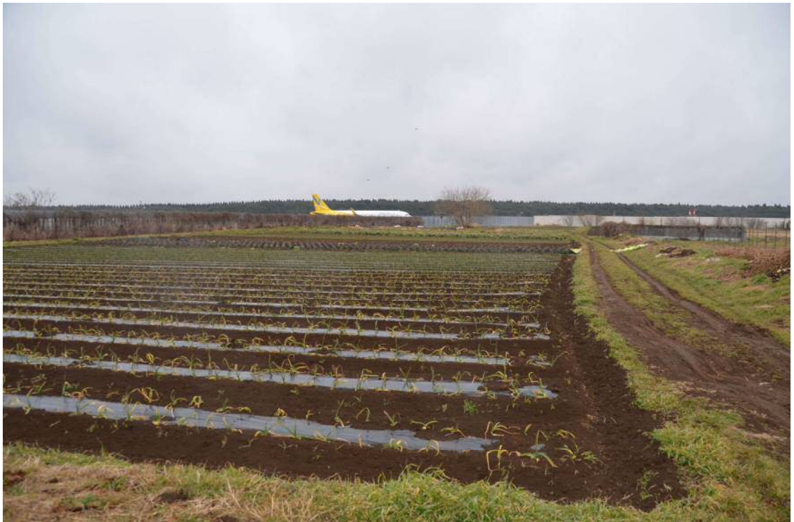
2017年2月9日、南台農地。農道の西端から東側を撮影した。