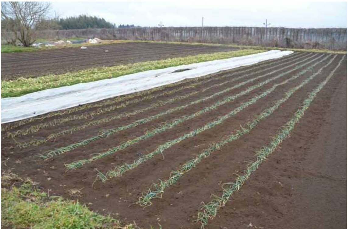
2017年2月9日、南台農地。農道北西側の玉ねぎ、小松菜、かぶ畑を撮影した。