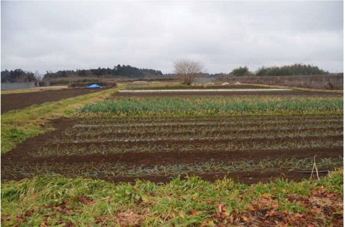
2017年2月9日、南台農地。旧市道から西側のタマネギ、長ネギ畑を撮影した。